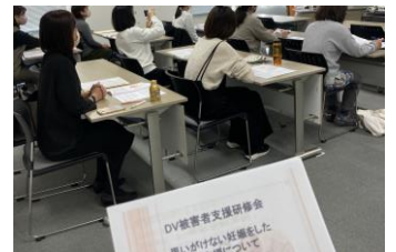
望まれない妊娠について