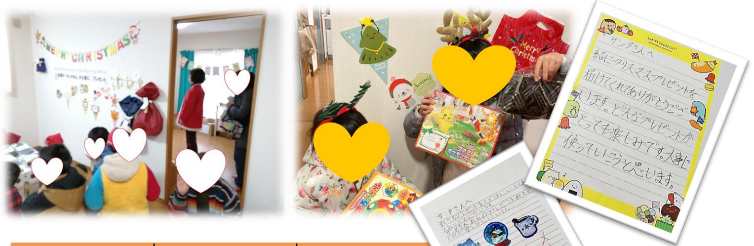
子ども達からのお礼のお手紙

皆様のおかげで沢山の親子の方が2022年も喜んでいただきました！ 12月の「クリスマス会」では117人の参加者！76人の子供たちにクリスマスプレゼントを渡すことができました。その他イベントでは子供たちの体験活動や地域の方との交流もできました。