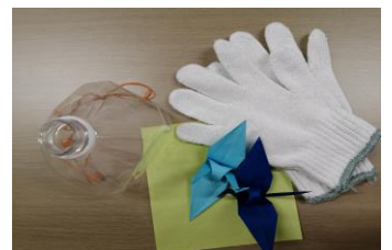
障害についての実践研修