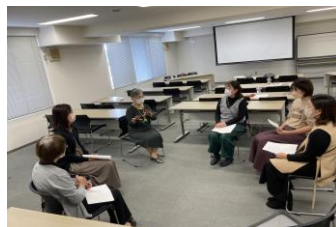
支援の隙間に埋もれる 子どもの支援について